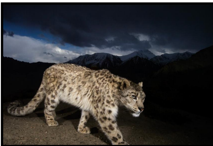
Parque Nacional de Hemis, Ladakh, Índia.

O fotógrafo Steve Winter precisou de 13 meses, muita experiência e alguma sorte para conseguir capturar o esquivo leopardo-das-neves através de armadilhas fotográficas. Uma fotografia desta série ganhou, em 2008, o primeiro prémio no prestigiado concurso Wildlife Photographer of the Year .