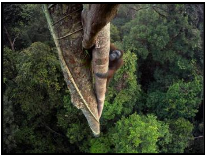
Calimantão, Bornéu, Indonésia.

A 30 metros do chão, este orangotango-de-bornéu trepa à procura de preciosos figos. Os orangotangos criam um mapa mental da floresta e utilizam-no para saber quando e onde podem encontrar fruta madura. A Indonésia perde anualmente milhares de hectares das suas florestas tropicais devido ao abate de árvores e às plantações