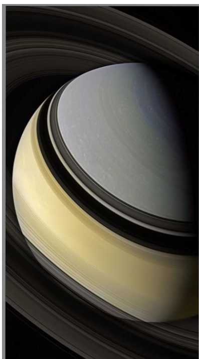
Panorâmica das regiões setentrionais de Saturno. Os anéis projetam uma faixa de sombra neste gigante gasoso. Cassini, 20 de janeiro de 2007.