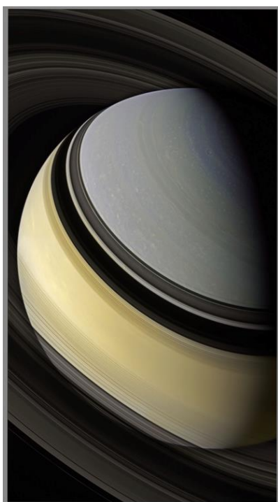
Panorâmica das regiões setentrionais de Saturno. Os anéis projetam uma faixa de sombra neste gigante gasoso. Cassini, 20 de janeiro de 2007.