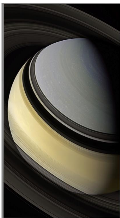
Panorâmica das regiões setentrionais de Saturno. Os anéis projetam uma faixa de sombra neste gigante gasoso. Cassini, 20 de janeiro de 2007.